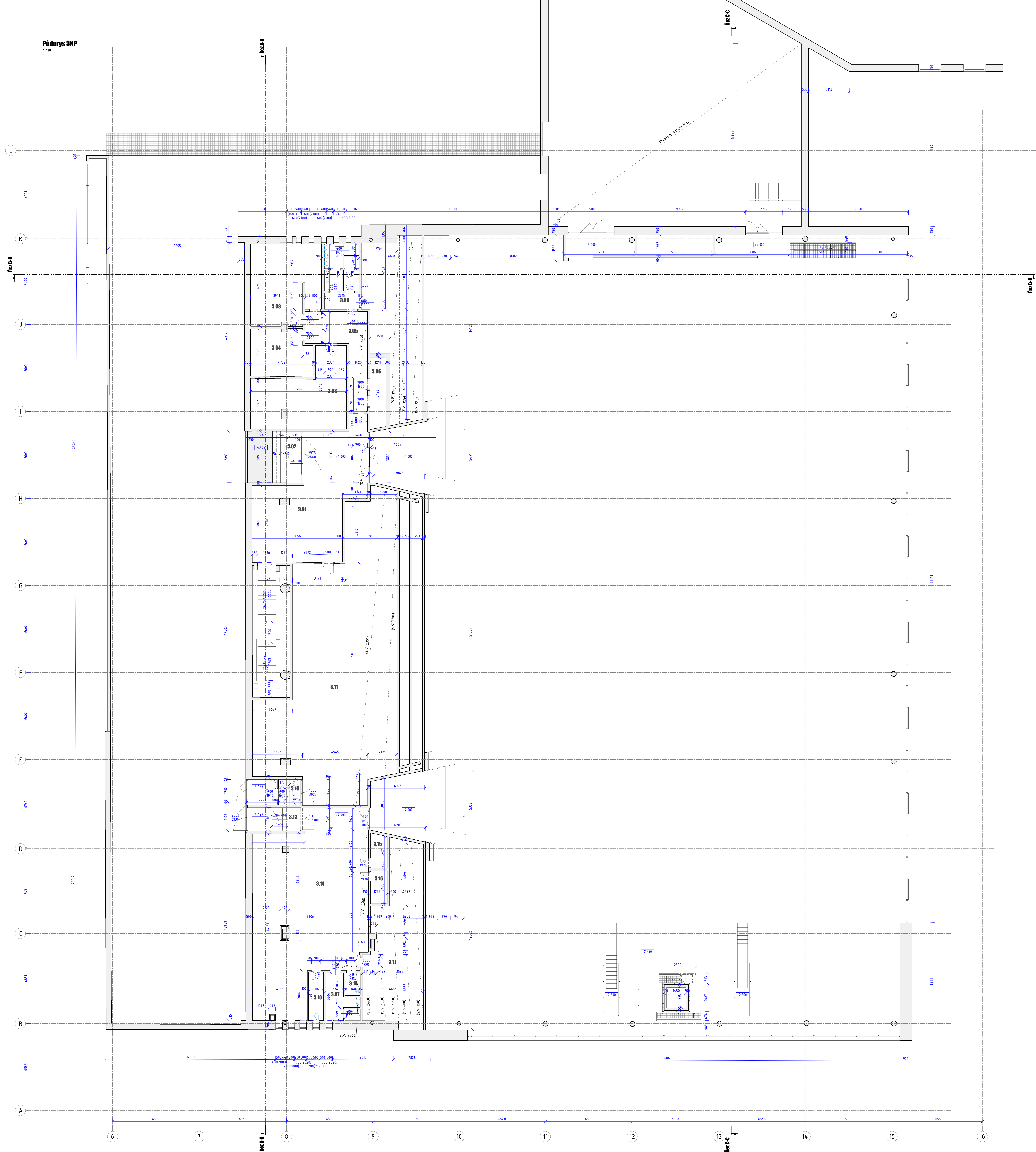
D pohleda na 3NP